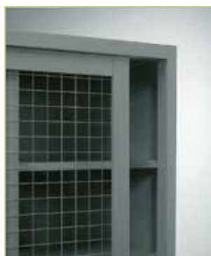
Anta in rete