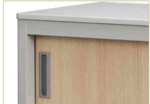
TOP standard in metallo