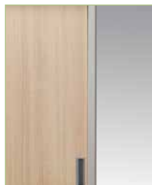
Ante in legno melaminico