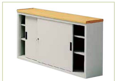
TOP in legno faggio